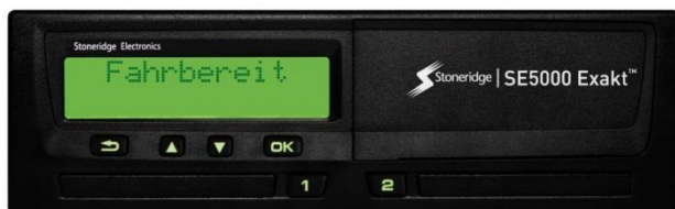
STONERIDGE SE 5000