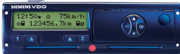
SIEMENS DTCO 1381